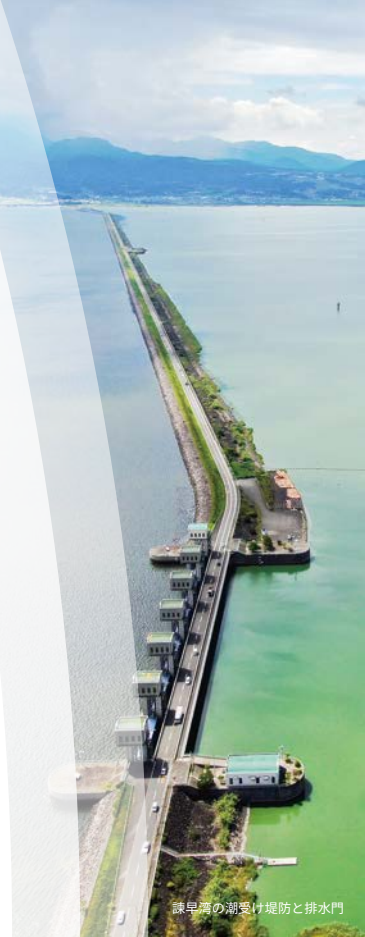
諫早湾の潮受け堤防と排水門