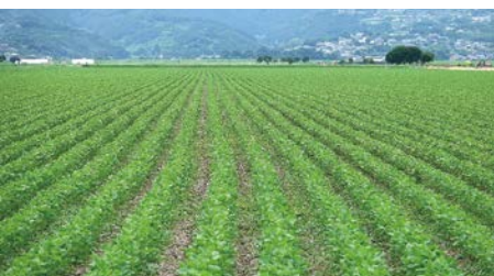
諫早湾干拓地での営農

現地では冬から春に収 穫の野菜の種や苗の植え 付けに向けて土づくりや 耕うんが始まっています。