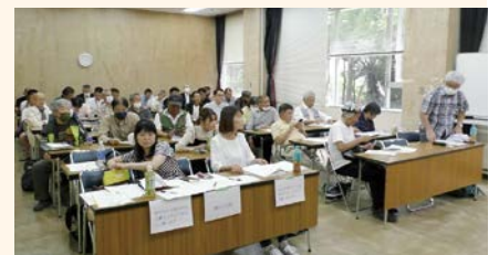
漁民ネット第20回総会 (6月18日、大牟田市労働福祉会館)

また将来食糧難になることを見越して世界が動いている中、日本の海産物自給率を上げる鍵を持つこの有明海をこのままにしていけない。今後国との「対話」が重要な局面を迎える中、なぜ有明海を再生し残さなければならないのか、開門し